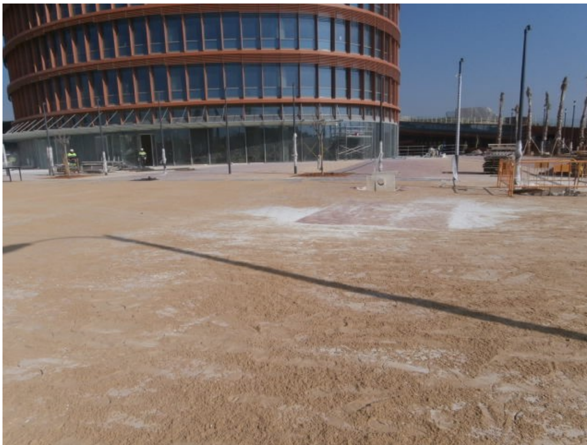
Fotografía no. 2

puede verse como los ciclistas han de compartir los rebajes para minusválidos y no queda clara la separación entre el paso ciclista y el paso peatonal.