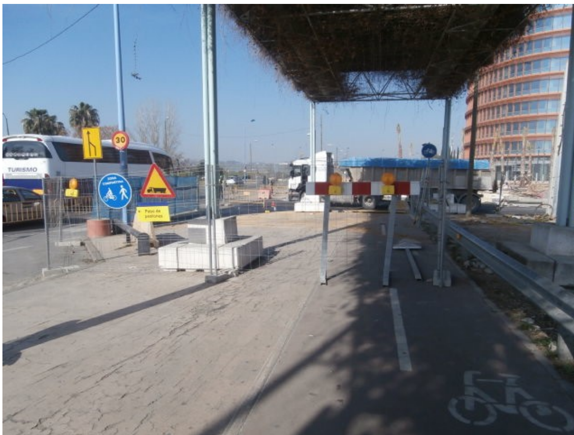
Fotografía no. 1

La situación de la zona se presenta en la foto de satélite, donde se ha marcado también la posición y orientación de las fotografías adjuntas. La foto de satélite corresponde a una situación anterior de las obras, donde todavía se observa la vía ciclista (en color rojizo) eliminada durante las actuales obras de reurbanización del acerado frente a la “Torre Pelli”.