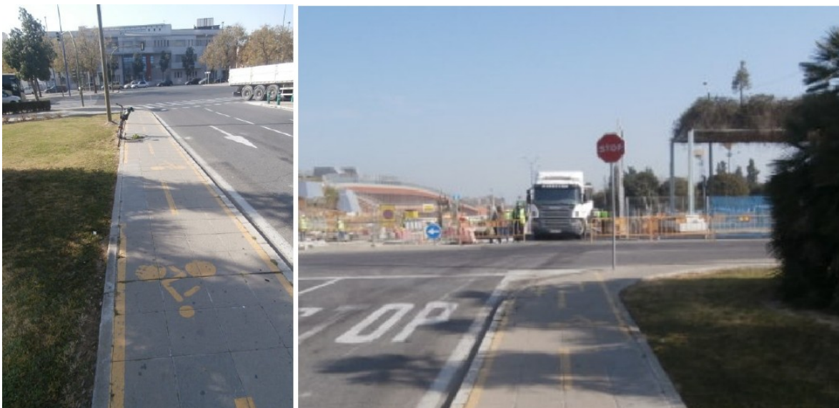
Fotografía no. 4 (izquierda) y 5 (derecha)