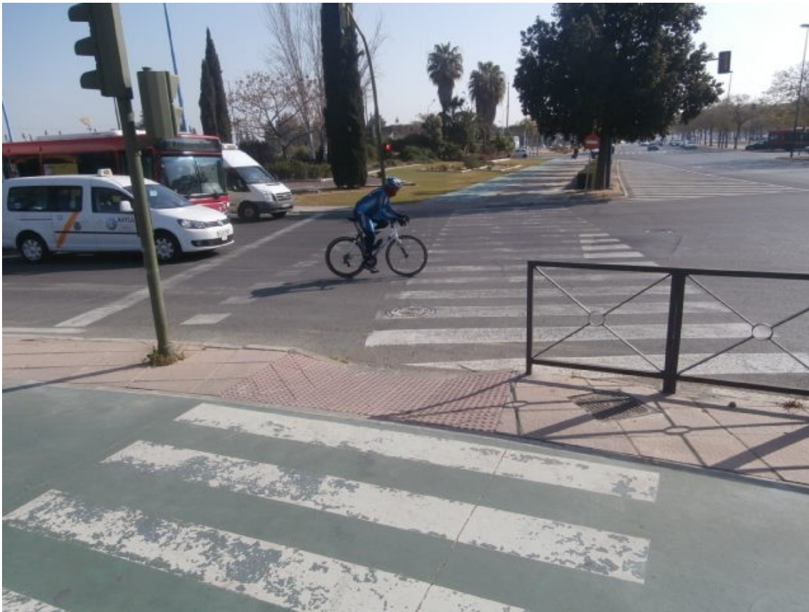
Fotografía no. 3

accesibilidad y se están realizando reformas en el viario que amenazan con interrumpir la continuidad de la red ciclista de Sevilla, en un punto neurálgico de la ciudad.