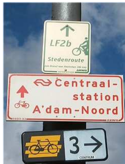
Señalización de itinerarios ciclistas. Amsterdam 2004.

Los itinerarios propuestos, verde y rojo, se ilustran en el mapa adjunto. Sus callejeros y una descripción de los lugares de interés a lo largo de los mismos se detallan en las dos tablas al final de esta propuesta. Dichos itinerarios no incluyen la totalidad de los monumentos ni sitios históricos de la ciudad – eso sería imposible –, simplemente hemos intentado diseñar dos itinerarios coherentes que recorren fundamentalmente el interior su Casco Histórico. Un paseo circular por su periferia, a lo largo de la Ronda Histórica, permitiría además visitar sitios como la Plaza de Toros de la Maestranza, el Puente de Triana, una visión exterior del recinto de la Expo'92, la cara exterior de la Muralla Almohade, el Jardín del Valle, el Prado de San Sebastián o el Palacio de San Telmo y los Jardines del Cristina; sitios todos ellos de indudable interés que no han sido incluidos en los itinerarios por ser fácilmente visitables desde la periferia del Casco Histórico. Como propuesta adicional, dirigida al Ayuntamiento, aconsejamos la disposición de una señalización específica a lo largo de los itinerarios propuestos, tal y como se hace en muchas ciudades europeas