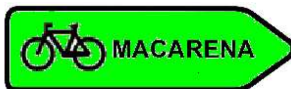
Propuesta de señalización para itinerario verde